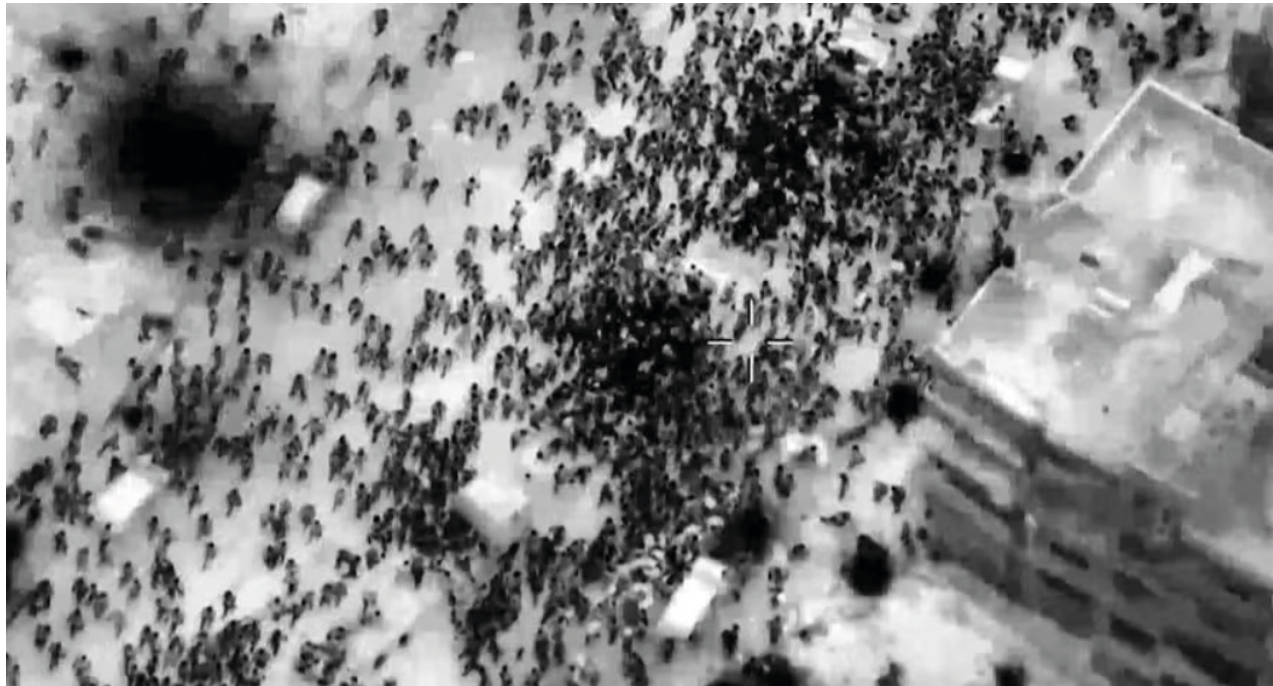
Forças Armadas de Israel divulgam vídeo mostrando multidões durante entrega de ajuda que deixou mortos

Israel contesta relato, mas reconhece que abriu fogo a oeste da cidade