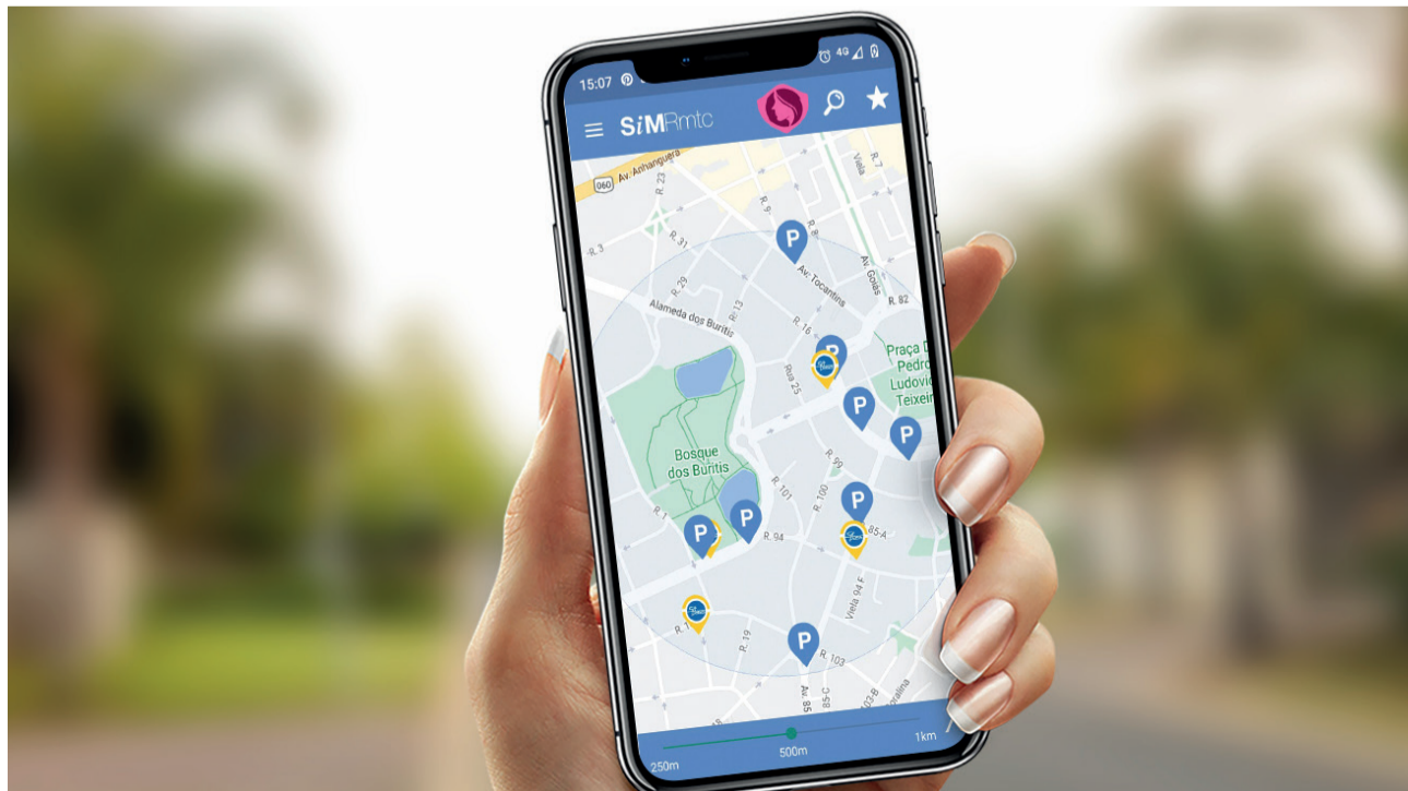
O aplicativo Mulher Segura agora está disponível também dentro do aplicativo SimRMTC

Outra novidade é que, como dois terços dos usuários são mulheres, haverá integração dos aplicativos Mulher Segura e SiMRmtc. Assim, elas terão acesso direto aos serviços oferecidos pela Segurança Pública do Estado, como localização e telefones de batalhões e delegacias mais próximas, registro de ocorrências e solicitação de viatura via chat.