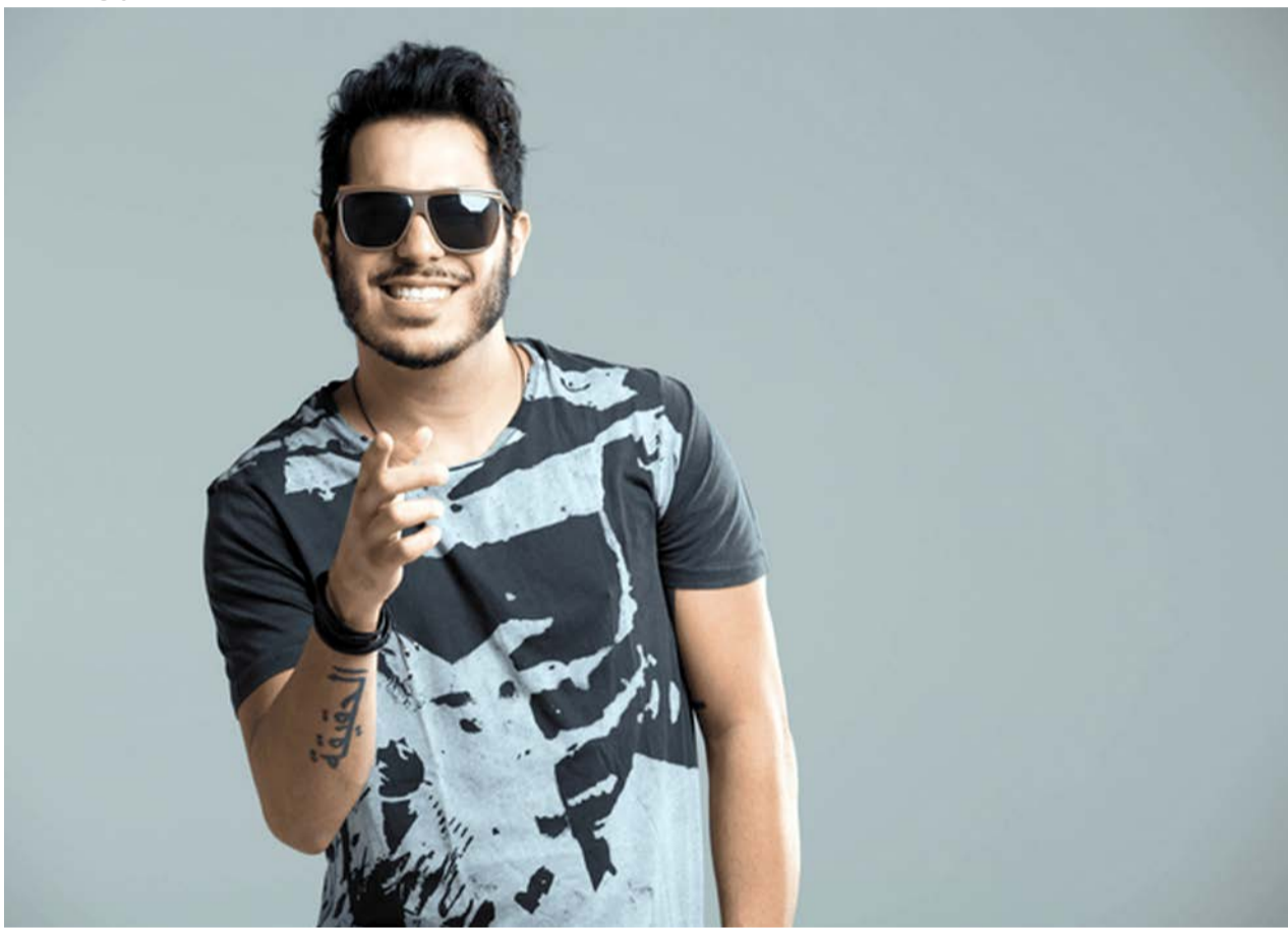
Tomate é atração do Bloco do Carneiro, em Goiânia

DA REDAÇÃO - Neste sábado (3), a alegria do Carnaval chegará às ruas de Goiânia com a estreia do Bloco do Carneiro. O desfile, que promete agitar os setores Bueno e Marista, terá início às 12 horas e contará com a presença de grandes artistas do cenário nacional, garantindo uma festa inesquecível.