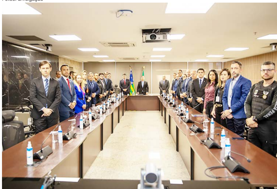
A solenidade foi realizada no Salão Nobre da Presidência do TJGO

O documento foi assinado ainda por representantes do Ministério Público do Estado de Goiás (MPGO), Defensoria Pública do Estado de Goiás (DPE-GO), Secretaria de Segurança Pública do Estado de Goiás (SSP-GO), Diretoria-Geral da Administração Penitenciária (DGAP), Polícia Civil do Estado de Goiás (PCGO), Polícia Militar do Estado de