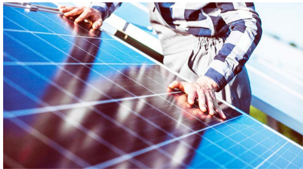
Freepik Arquivo Pessoal Cliente comprou sistema de energia solar, mas não recebeu o produto e ainda teve o nome negativado

A energia solar tem muitas vantagens, mas é preciso estar atento à empresa escolhida para comprar e instalar todo o aparato. Decisão da juíza Laryssa de Moraes Camargos, da 6ª vara cível de Anápolis, cidade a 55 km de Goiânia, favoreceu cliente que comprou o sistema solar para sua construtora e não teve