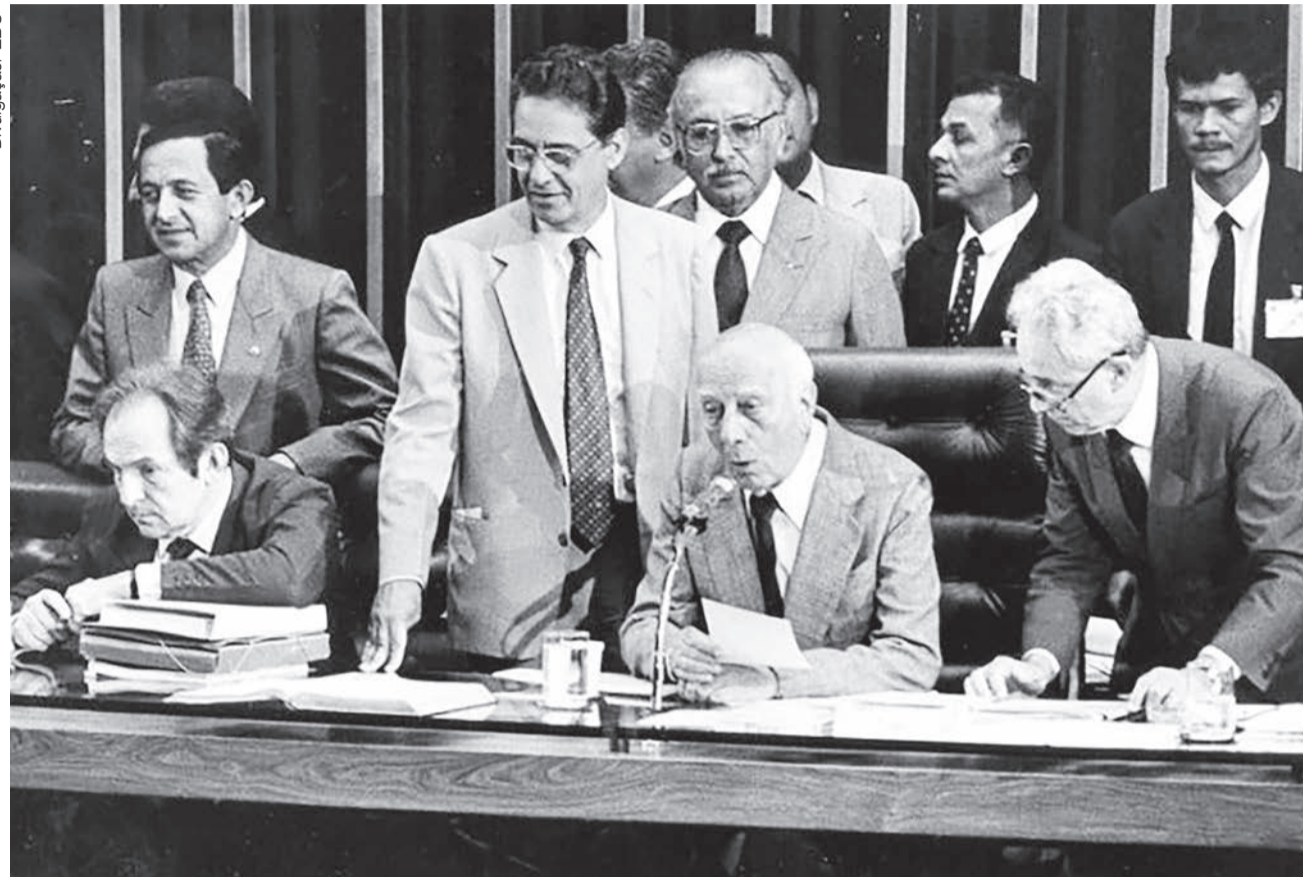
Assembleia Nacional Constituinte completa 30 anos de instalação. Na foto, o dia da promulgação do texto

Outra razão para que, após três décadas e meia de profundas mudanças sociais e culturais, o texto de 1988 continue sendo chamado de A Constituição Cidadã é o fato de segmentos populares