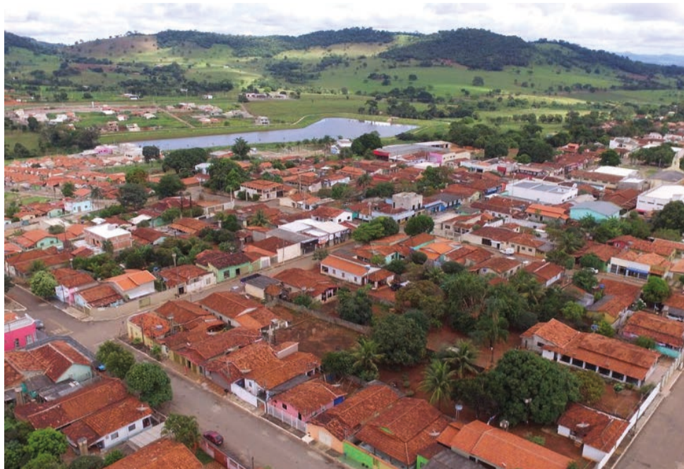
Visão panorâmica da cidade de Taquaral de Goiás