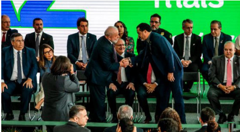
Governador cumprimenta o presidente Luiz Inácio Lula da Silva durante sua participação nos pronunciamentos da cerimônia