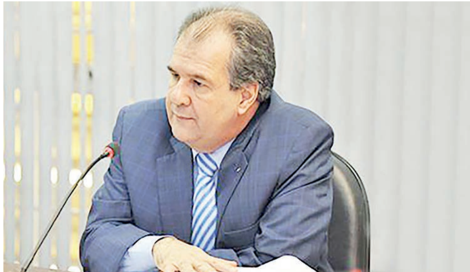
Juiz Jesseir Coelho de Alcântara

Para o magistrado, ficou claro que há indícios de que a aeronave, de prefixo PT-YFK, “pode ter sido utilizada como instrumento de atividade criminosa no que concerne ao tráfico ilícito de drogas, bem como possa ser proveito dela”, destacou.