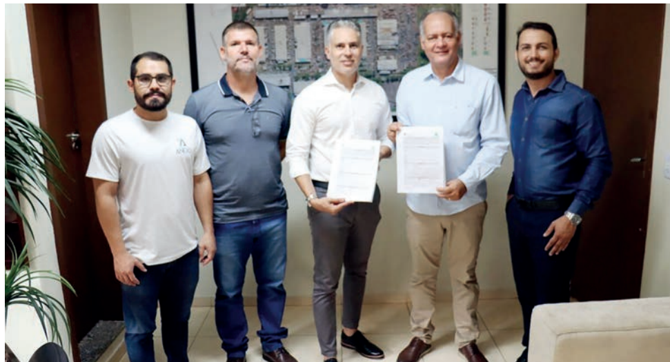
Representantes da Ceasa e da Anexo Energia durante assinatura de contrato para construção do sistema biodigestor

DA REDAÇÃO - A empresa goiana Anexo Energia Esco Goiás Eireli, ligada ao Instituto Tecnológico Anexo Brasil, foi a vencedora do processo licitatório para a construção do sistema de biodigestor da Centrais de Abastecimento de Goiás (Ceasa Goiás). O contrato prevê um investimento por parte do governo estadual na ordem de R$ 4,97 milhões.