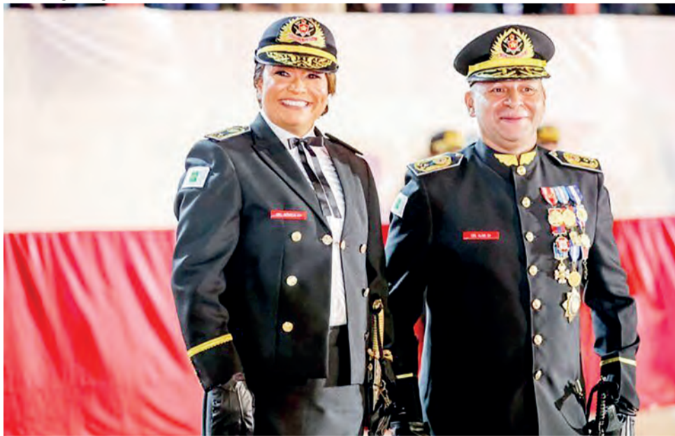
Coronel Mônica de Mesquita substituiu o coronel Alan Alexandre Araújo no comando do CBMDF

Na noite de 8 de março de 2023, o comando do Corpo de Bombeiros Militar do Distrito Federal (CBMDF) passou a ser liderado por uma mulher, marcando uma importante conquista para igualdade de gênero, fruto da luta constante pelo reconhecimento da capacidade das mulheres em todas as áreas de atuação.