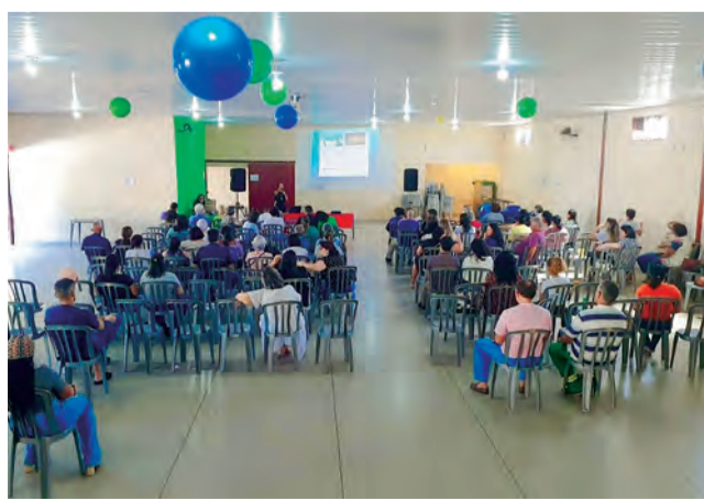
Conferência Municipal de Saúde de Goiânia é realizada entre 15 e 17 de março, com tema: garantir direitos e defender o SUS, a vida e a democracia

O tema central deste ano é “Garantir direitos e defender o SUS,