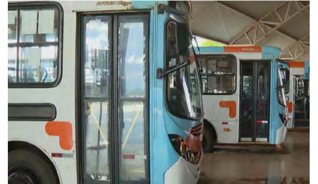
Ônibus do Entorno do Distrito Federal estacionado na Rodoviária do Plano Piloto

Entorno, barrada pelo STF, a gestão foi devolvida para a União.