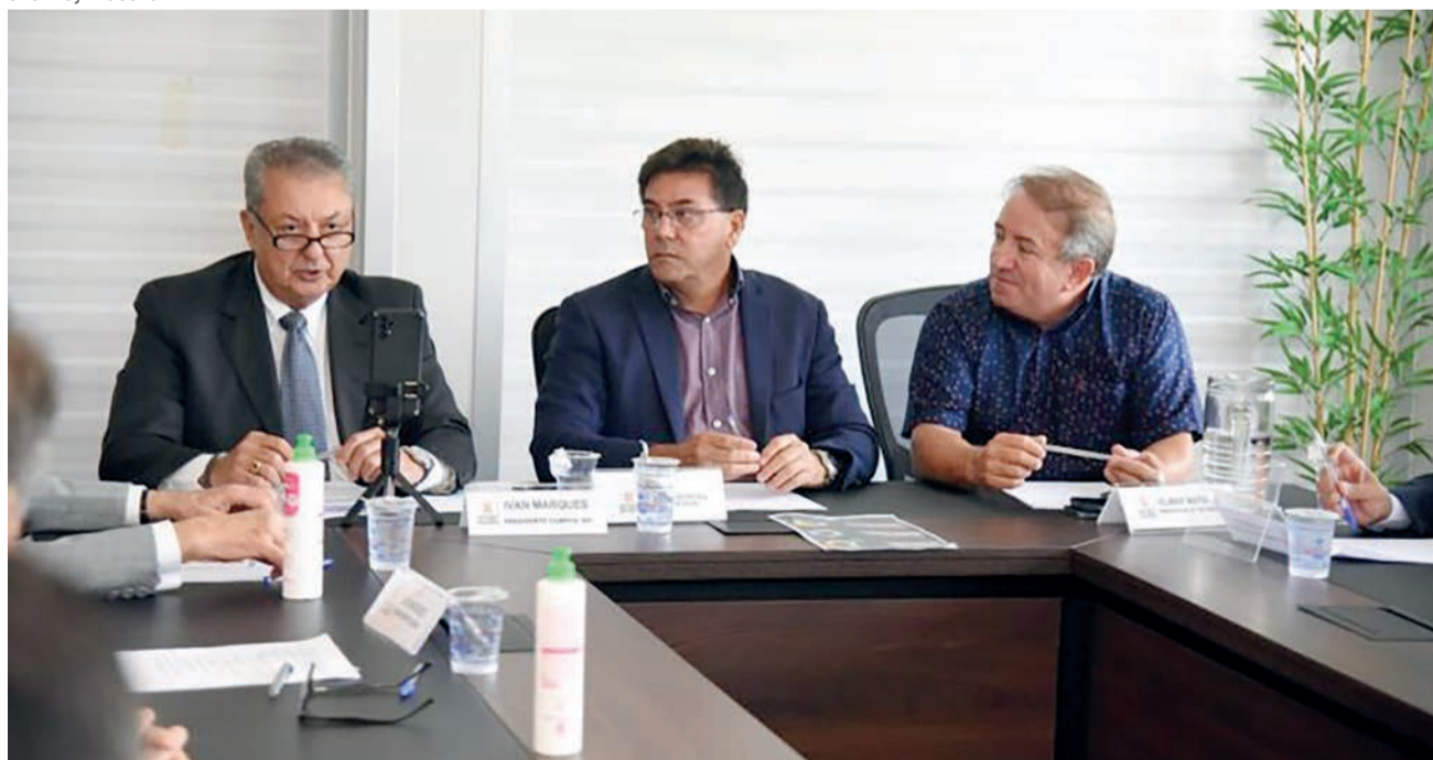
A Associação Comercial e Industrial de Aparecida de Goiânia promoveu o 1º Encontro de Negócios Brasil-Portugal

Durante o encontro, foram discutidas as potencialidades de produção de Aparecida de Goiânia e da cidade portuguesa de Beja, que foi escolhida pelas condições logísticas favoráveis para exportação dos produtos produzidos na cidade brasileira para toda a Europa. Além disso, cidades portuguesas se colocaram à disposição para