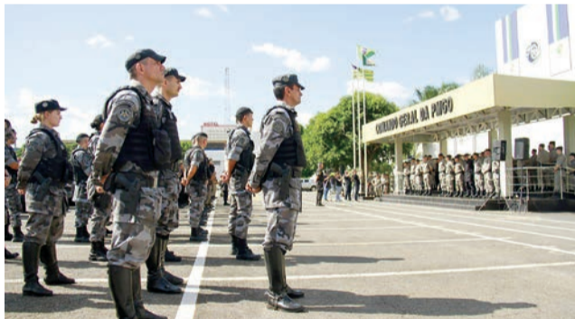
Operação Carnaval: reforço de efetivo e viaturas garantem segurança de foliões

O Corpo de Bombeiros Militar emprega efetivo extra de 214 militares, 71 viaturas, 23 embarcações e 29 mergulhadores para o feriado