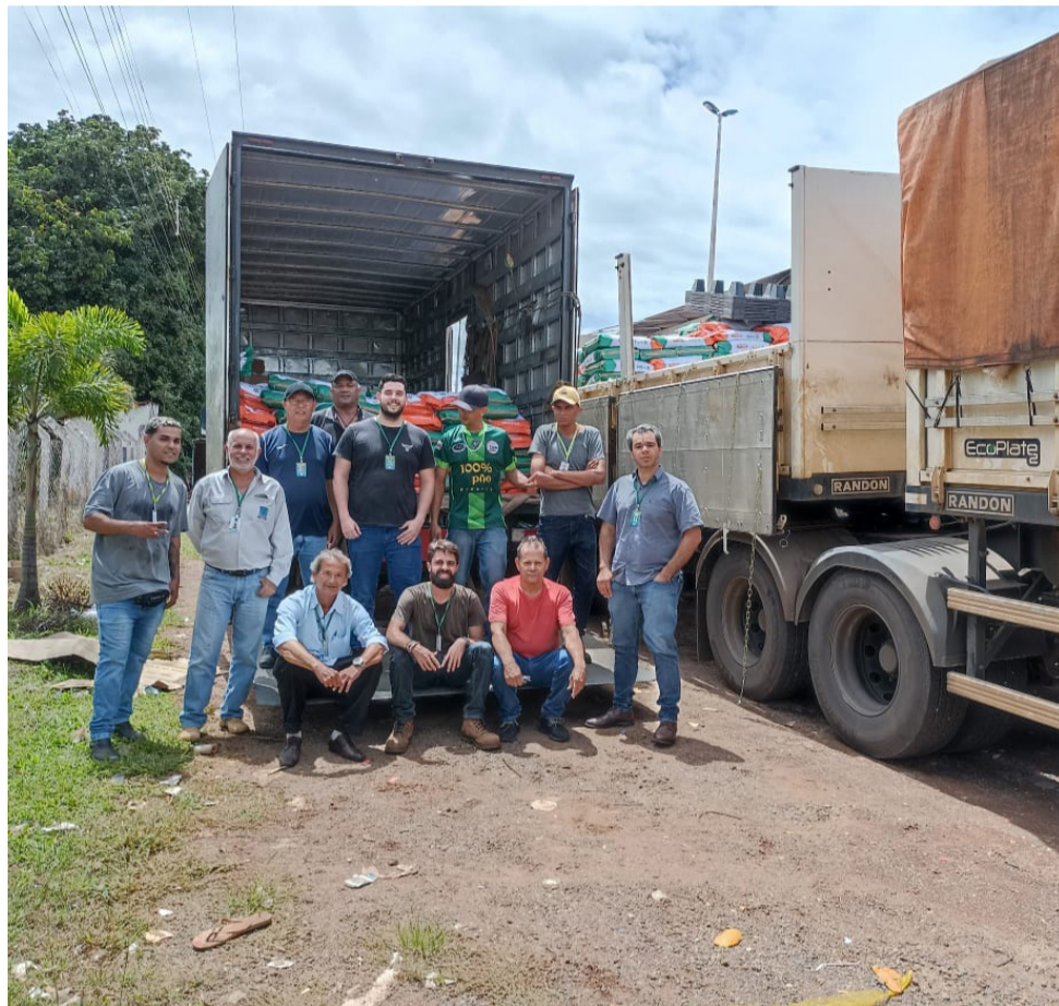
Primeiro carregamento de semente de milho segue para distribuição a agricultores familiares de Teresina de Goiás e região

Assentamentos e quilombos com pequenos agricultores mais vulneráveis vão receber insumo que deve gerar até R$ 10 milhões em renda