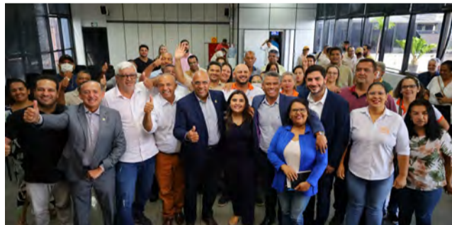
Rogério Cruz sanciona lei que implanta Plano de Carreira dos Agentes de Saúde e de Combate às Endemias

"Nós sabemos da importância do trabalho dos agentes em campo para a prevenção de doenças. A gestão do prefeito Rogério Cruz vai entrar na história pela valorização dessas categorias. 2023 será um ano desafiador,