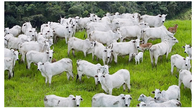
Agrodefesa finaliza última campanha contra febre aftosa no Estado que está há 26 anos sem registro de focos da doença

O resultado da campanha é fruto do esforço do Governo de Goiás junto aos pecuaristas, com suas entidades representativas e atu-