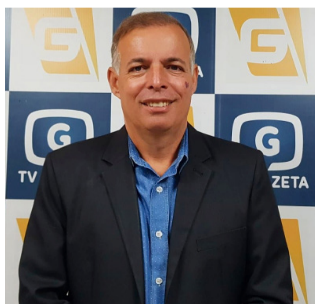
A entrevista foi concedida no programa Café com Prosa

O Prefeito também destacou a ciência produtiva da cidade. "A base de Cromínia sempre foi o leite, porém agora a soja tomou conta do mercado. Há seis anos atrás quando iniciei o primeiro mandato tivemos uma enorme dificuldade, a cada 10 visitas que recebia na Prefeitura 9 era para pe-