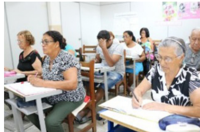
Prefeitura de Goiânia está com matrículas abertas para Educação de Jovens e Adultos

A Prefeitura de Goiânia, por meio da Secretaria Municipal de Educação, está com matrículas abertas para Educação de Jovens e Adultos (EJA) em 2023. A modalidade atende a todos que tiveram seu processo educacional interrompido e não puderam concluir os estudos na idade apropriada. As vagas são ofertadas em 55 escolas e 9 extensões.