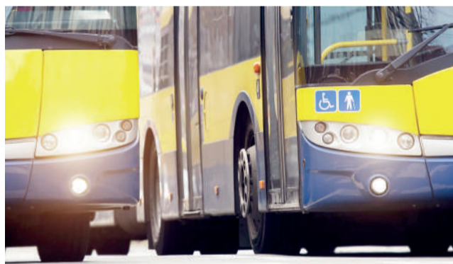
Solução entrará em vigor hoje (10) e a passagem passa a custar R$ 2,15 para circulação interna no município

Atualmente, os moradores de Goianira pagam passagem no valor de R$ 4,30 para utilizar o sistema de trans-