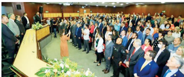
36 órgãos de gestão do Estado alcançaram nota máxima na avaliação

Ao todo, foram premiados por atingirem a nota máxima no quesito transparência pública 29 órgãos da Administração Direta do Governo de Goiás (ABC, AGR, Agrodefesa, Casa Civil, CGE, Corpo de Bombeiros Militar, DGAP, DGPC, Economia, Emater, Fapag, Goinfra, GoiásPrev,