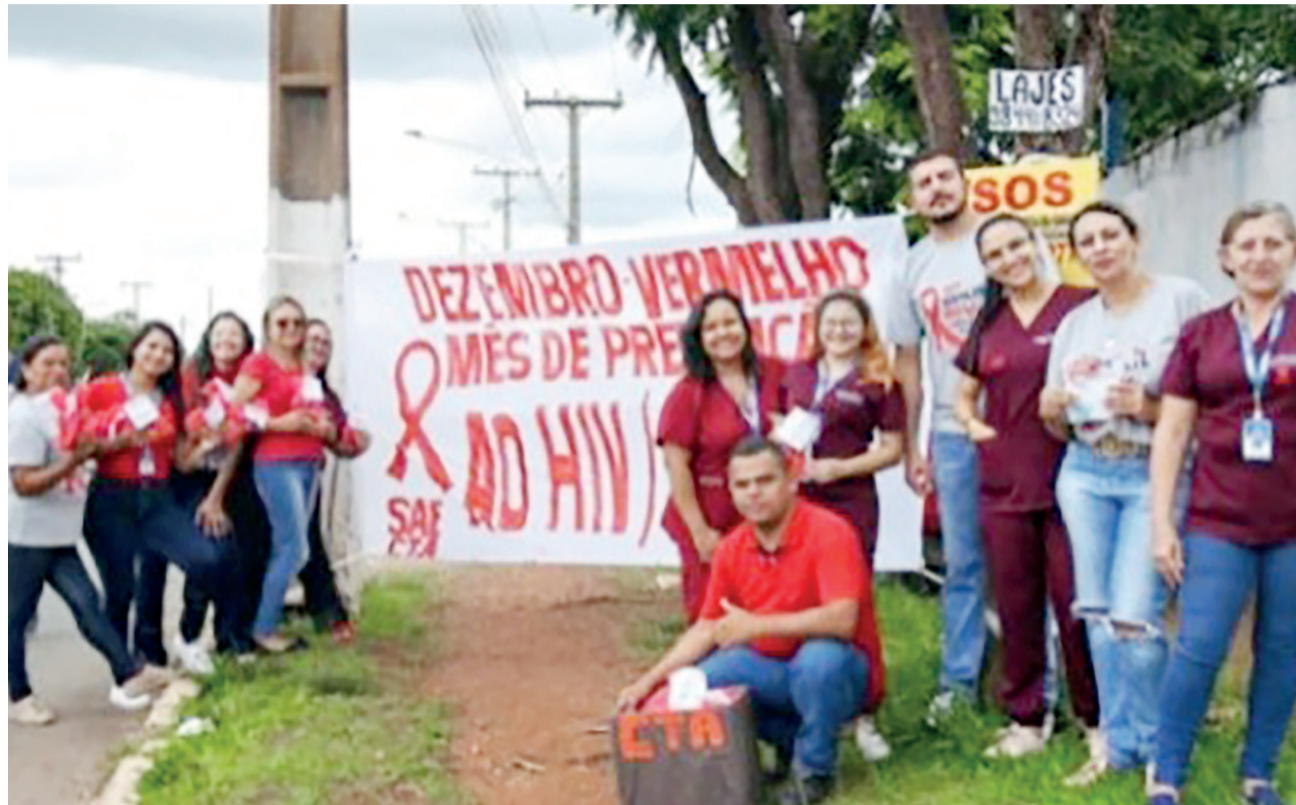
Durante o evento, foi realizada testagem de HIV e entrega de cartilhas

cêutico faz a solicitação. Em seguida, o paciente passa