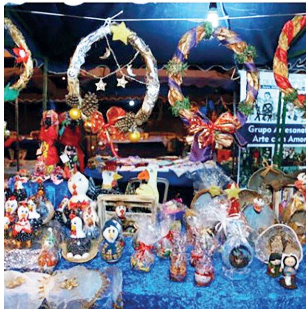
As inscrições começaram na quarta feira e segue até esta sexta feira (09)

Planejamento e Regulação Urbana, situada no 1º andar da Cidade Administrativa Maguito Vilela, na Rua Gervásio Pinheiro, Residencial Solar Central Park. Mais informações o interessado pode acessar a Portaria Nº 10, publicada no Diário Oficial Eletrônico do município (DOE), no dia 05 de dezembro de 2022, ou ligar no telefone 3238-7210.