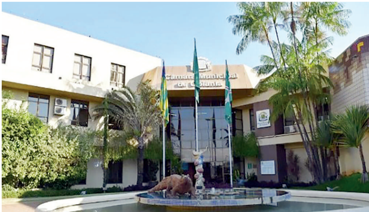
Câmara Municipal de Goiânia, no Setor Central

1,5 milhão de habitantes e deve se manter até quando houver 1,8 milhão.