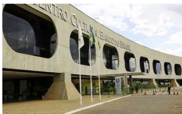
Equipe de transição identifica problemas em programas do governo

A senadora disse que também seria necessário incluir mais R$2 bilhões do