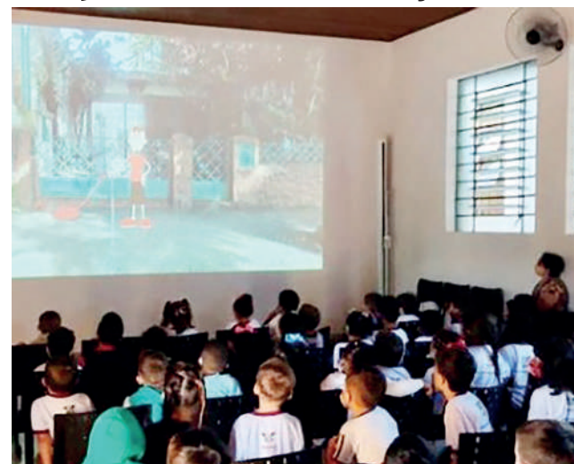
Projeto Natal na Praça vai a 13 municípios goianos: objetivo é exibir filmes natalinos em espaços públicos no mês de dezembro

O Governo de Goiás, por meio da Secretaria de Estado da Cultura (Secult), lançou o projeto Natal na Praça. O objetivo da iniciativa é exibir filmes com temática natalina em 13 municípios goianos e reunir famílias para celebrar a data durante o mês de dezembro. As sessões são gratuitas e realizadas em locais públicos sempre às 19 horas.