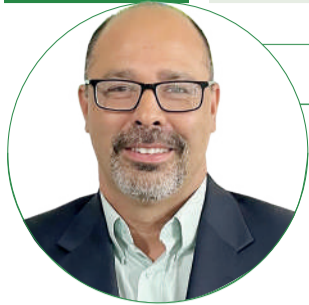
■ Bartolomeu de Gusmão