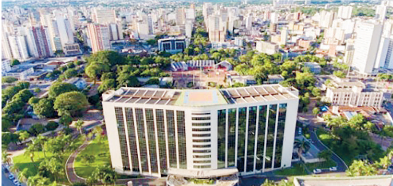
Candidatos aprovados em concurso público da Sead têm 30 dias para tomar posse

de atender demandas da Sead, candidatos aprovados na função de desenvolvedor também podem ser