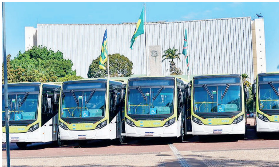
Além de garantir manutenção do valor da passagem em R$ 4,30, Governo de Goiás investe em novos serviços e formatos de bilhetagem

O convênio entre Estado e prefeituras tem permitido, além da manutenção do valor da tarifa, o lançamento de novos formatos de bilhetagem desde o primeiro semestre deste ano, como o Bilhete Único, o Passe Livre do Trabalhador e, recentemente, a Meia Tarifa, que já foi adotada em Senador Canedo e Nerópolis. “Nossa expectativa é de que