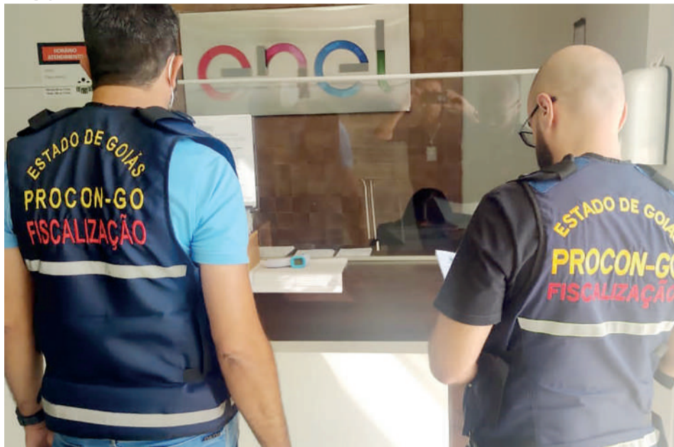
Procon Goiás notifica Enel por falta de energia durante o período de chuvas na capital

ros e, principalmente, a demora no restabelecimento da energia elétrica aumentaram após o anúncio da venda da companhia para o Grupo Equatorial.