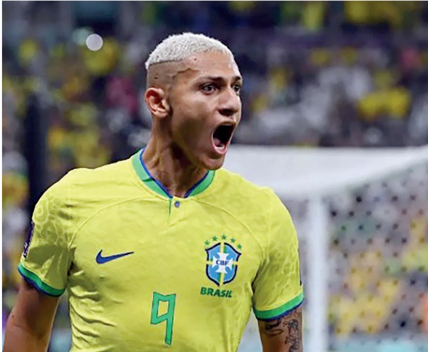
Richarlison festeja gol contra a Sérvia

DA REDAÇÃO - O Brasil começou com vitória o caminho em busca do hexacampeonato mundial: a equipe comandada por Tite estreou na Copa do Mundo 2022 vencendo a Sérvia por 2x0 na última quinta-feira, no estádio Lusail. O próximo jogo da Seleção será amanhã, dia 28 de novembro, contra a Suíça.