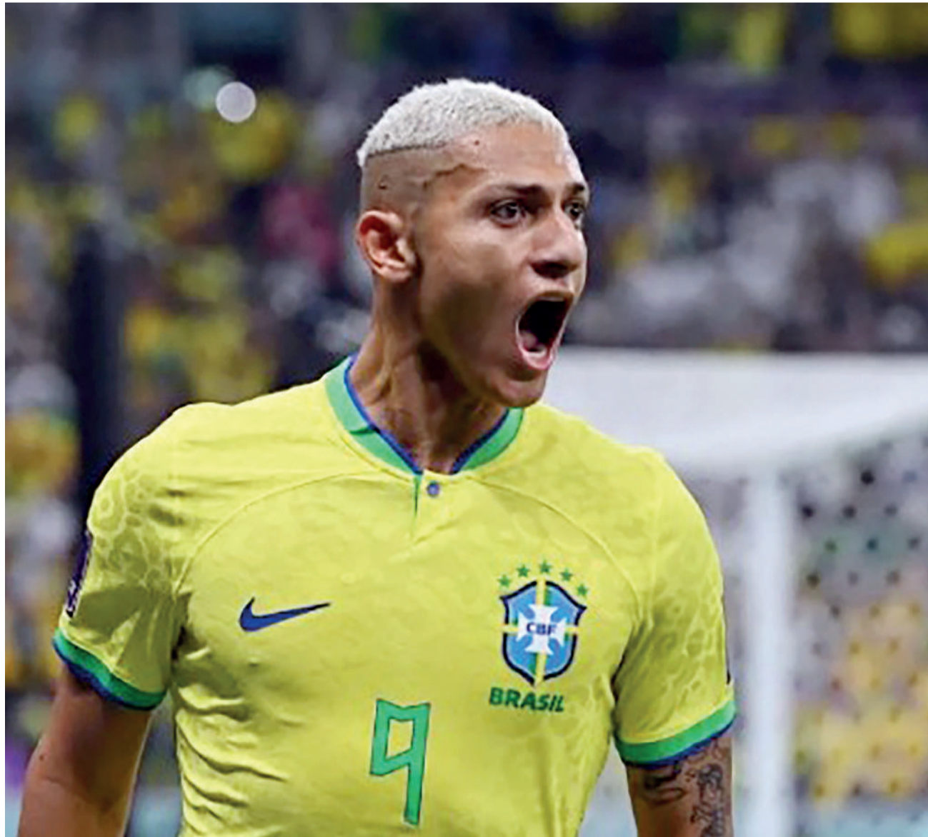
Richarlison festeja gol contra a Sérvia