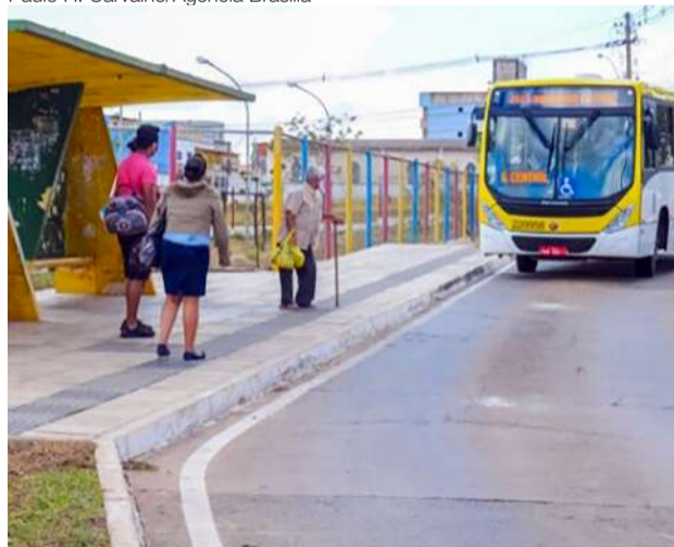
Novo documento proporcionará aos usuários idosos mais facilidade no acesso aos ônibus

próxima semana, inicialmente, nos postos do BRB Mobilidade, mediante apresentação de CPF, documento pessoal e oficial que faça prova de idade e foto 3x4 recente. O fornecimento da primeira via é gratuito, e o prazo para entrega do cartão é de até dez dias úteis após a aprovação do cadastro.