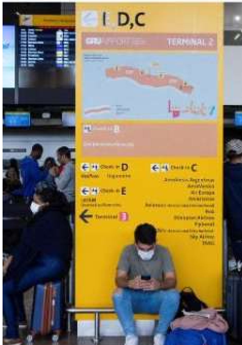
Uso de máscaras volta a ser obrigatório em aeroportos

Medida foi aprovada pela Anvisa devido ao aumento de casos de covid-19