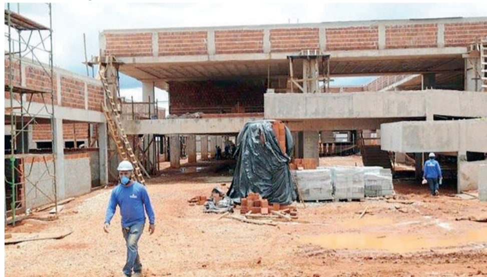
A Escola Técnica de Santa Maria será entregue ainda em 2022. Também está prevista para este ano a entrega da unidade do Paranoá

O segundo mandato do Governador Ibaneis Rocha será marcado pelo investimento na construção de creches, escolas técnicas e em tecnologia. A aplicação de recursos nessas áreas foi confirmada pela secretária de Educação, Hélvia Paranaguá, na comissão de transição, grupo que discute o planejamento de governo no Centro Internacional de Convenções do Brasil (CICB).