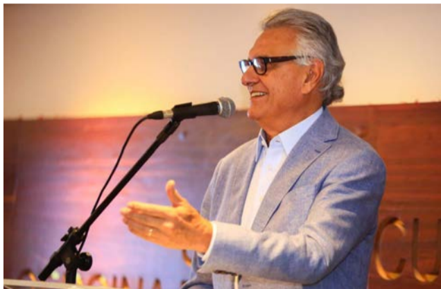
Governador Ronaldo Caiado sobre ampliação de limite para contratação de empréstimo consignado: "prerrogativa do Executivo", afirma