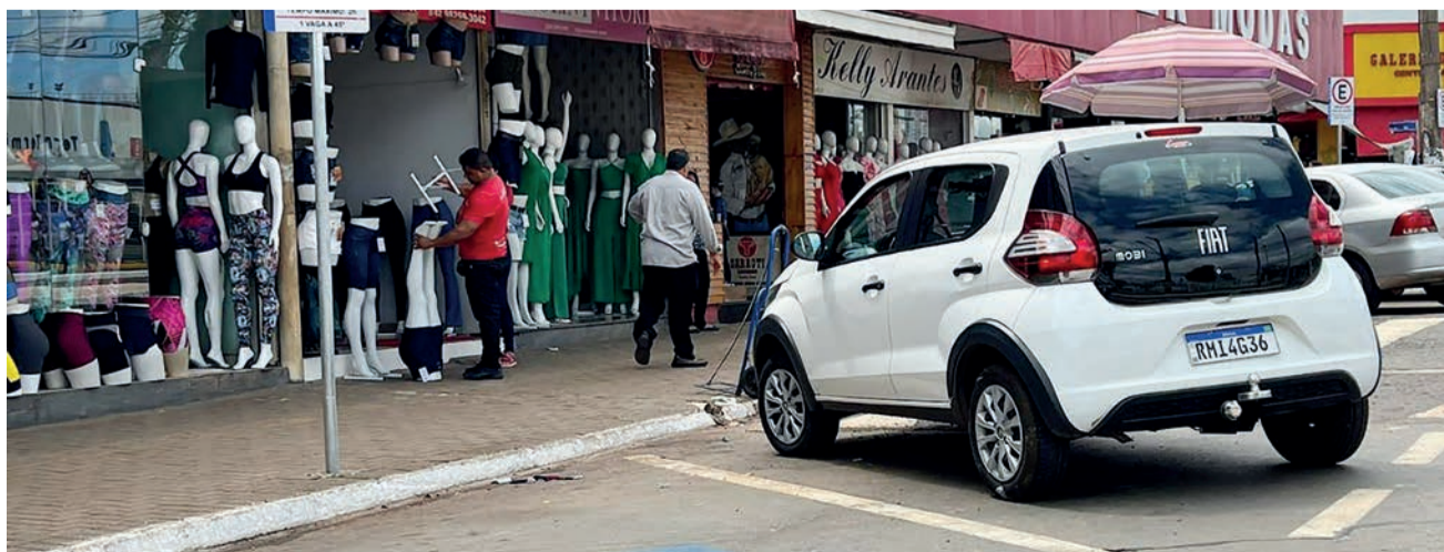
A Prefeitura de Goiânia abre venda de cartões da Área Azul, na Região da 44