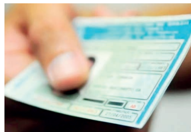
A segunda edição do Programa Habilitação Social recebeu 29.262 inscrições de pessoas em vulnerabilidade social