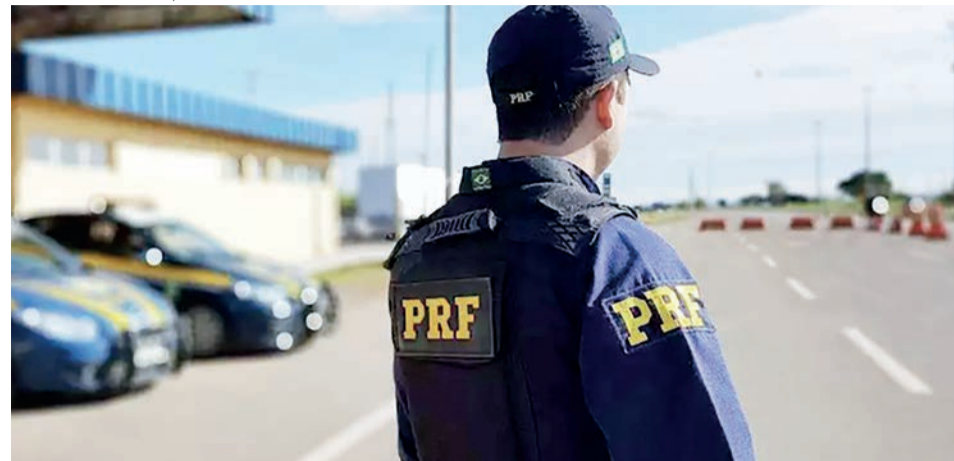
Alexandre de Moraes proibiu realização de qualquer operação

A Polícia Rodoviária Federal (PRF), realizou ao longo deste domingo (30) abordagens em transportes públicos. Até às 12h35, o órgão já havia realizado 514 ações de fiscalização contra os veículos.