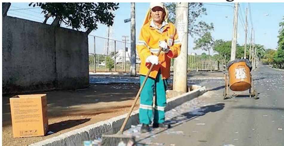
A ação contemplou todos os 356 colégios eleitorais da capital

A ação promovida pela Prefeitura de Goiânia foi uma medida preventiva do município para conter o descarte de qualquer material eleitoral, de forma indevida, em calçadas, ruas e avenidas em virtude do 2º turno das eleições, neste domingo (30).