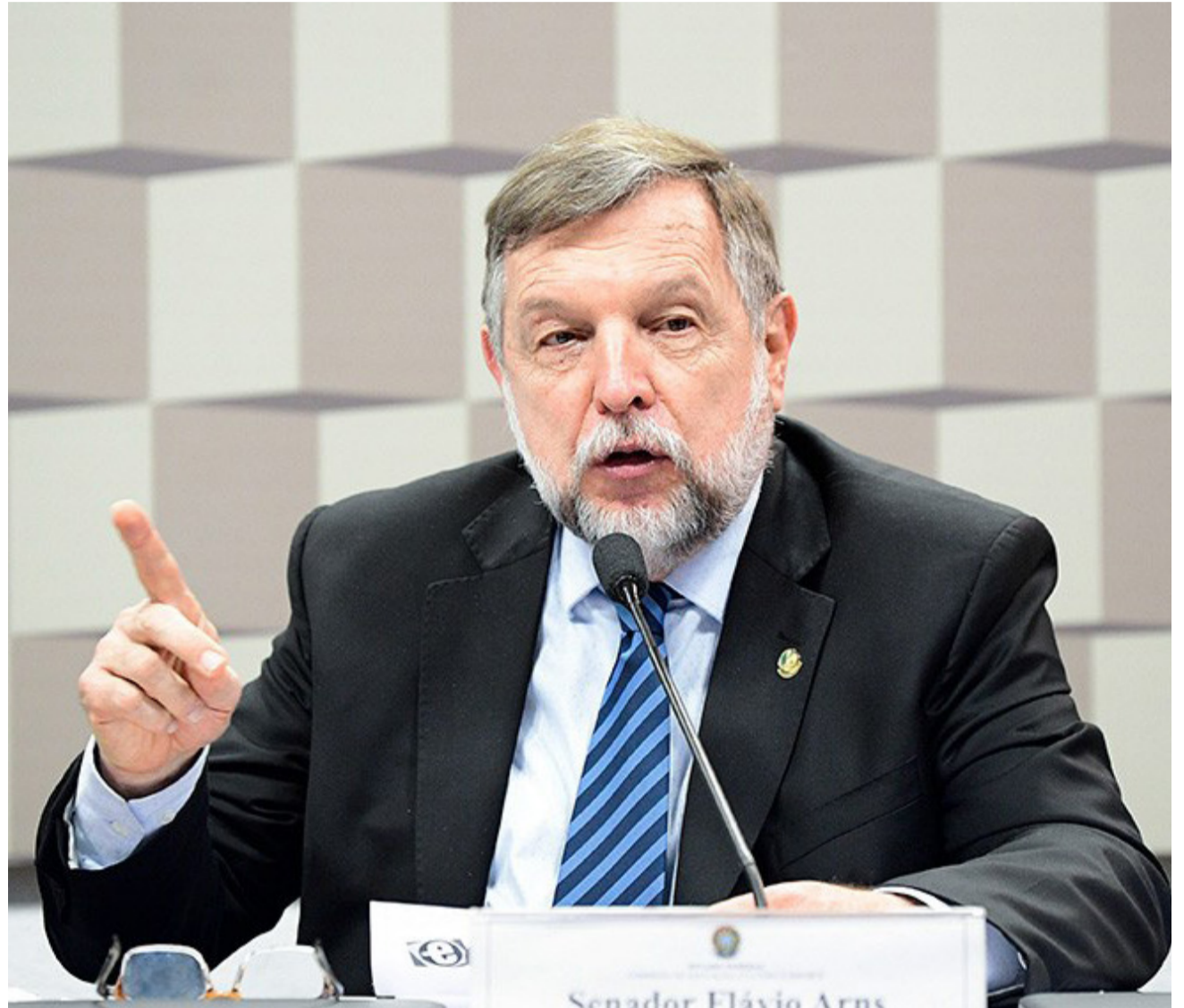
Arns é relator do projeto e pediu a audiência