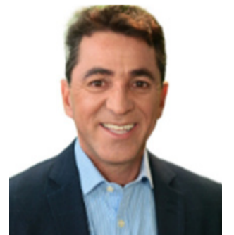
CABO SENNA (PATRIOTA)