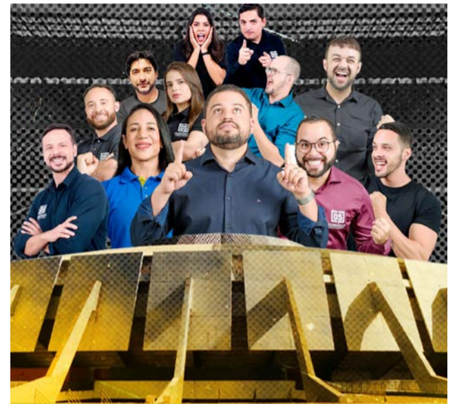
Os Pedagógicos Cursos e Concursos - O maior aulão da história

O evento para 10 mil pessoas acontecerá no Ginásio Nilson Nelson na capital do Brasil