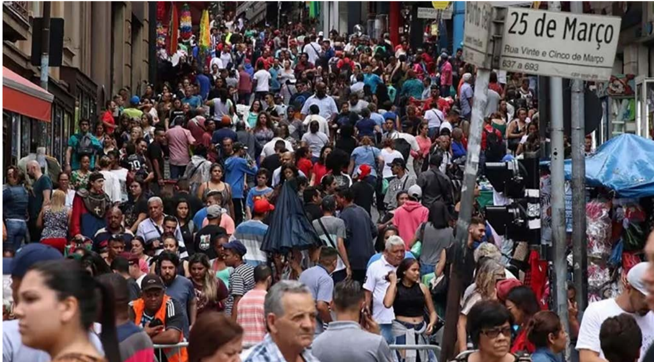
Em 200 anos, desde a Independência, a expectativa de vida no Brasil se multiplicou por três

não fossem as perdas de vida causadas pela pandemia.