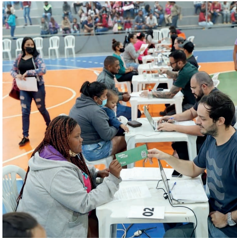
Famílias são atendidas com Aluguel Social pela equipe da Agehab em Cristalina

DA REDAÇÃO - O Governo de Goiás, por meio da Agência Goiana de Habitação (Agehab), incluiu esta semana mais 1.600 famílias no Aluguel Social. Beneficiários de Catalão, Cristalina, Luziânia e Valparaíso foram chamados para entregas em três dias de atendimentos. O programa é um complemento de renda para famílias em situação de vulnerabilidade financeira, com aporte mensal de R$ 350.