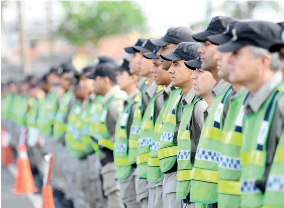
Goiás mantém redução do número de mortes violentas intencionais no primeiro semestre de 2022

anos, o Governo de Goiás intensificou o trabalho nas regiões metropolitanas da Capital e