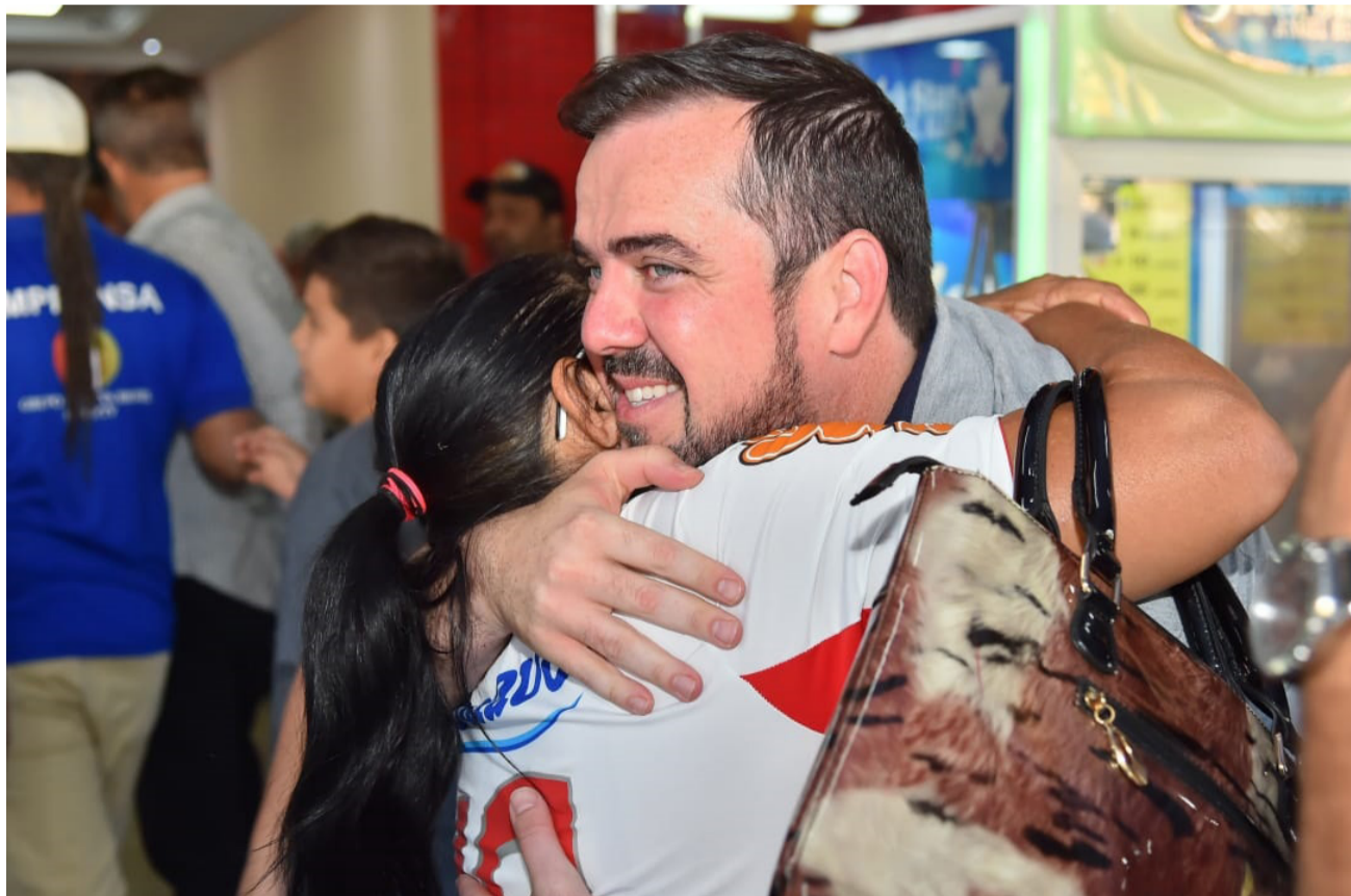
Uma família com cinco pessoas, por exemplo, que hoje recebe R$ 250 passaria a receber R$ 1.050,00

A proposta apresentada por Mendanha é unificar os programas sociais em um cartão único, com foco no núcleo familiar. Ou seja, ao invés de existirem vários projetos, com critérios diferentes, a Mendanha quer concentrar em um, reduzindo a burocracia, evitando filas e atos politiquieiros, segundo ele, pois, a intenção é resolver o problema e não usar benefícios como barganha de voto, como faz o atual governo estadual que, em 2019, acabou com o programa Renda Cidadã e agora faltando poucos meses pra eleições lançou os programas Mães de Goiás e o Bolsa Estudo para estudantes do ensino médio.