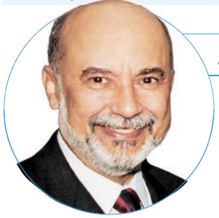
■ Paiva Netto