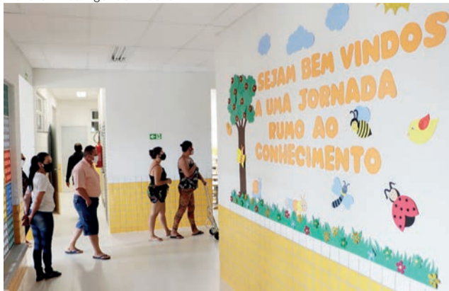
O Cepi Jandaia, primeira creche pública do Sol Nascente/Pôr do Sol, foi inaugurado em novembro de 2021

ideia é concluir as licitações e iniciar as obras ainda neste ano”, afirmou.