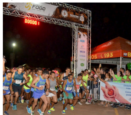
Largada da Corrida do Fogo 2019