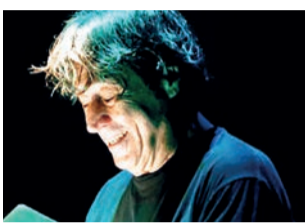
Hugo Rodas será o novo nome do Teatro Galpão