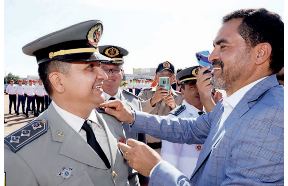
Governador Wanderlei Barbosa participa da cerimônia de formatura de 45 bombeiros militares que fizeram o Curso de Habilitação de Oficiais da Administração

DA REDAÇÃO - O governador do Tocantins, Wanderlei Barbosa, participou na manhã desta quarta-feira, 20, da cerimônia de formatura de 45 bombeiros militares que fizeram o Curso de Habilitação de Oficiais da Administração (CHOA 2021/2022). Também houve a entrega de 46 medalhas de Mérito Bombeiro Pioneiro e a assinatura do ato de promoção de 276 bombeiros militares. O evento ocorreu na sede do Quartel do Comando-Geral do Corpo de Bombeiros Militar, em Palmas.