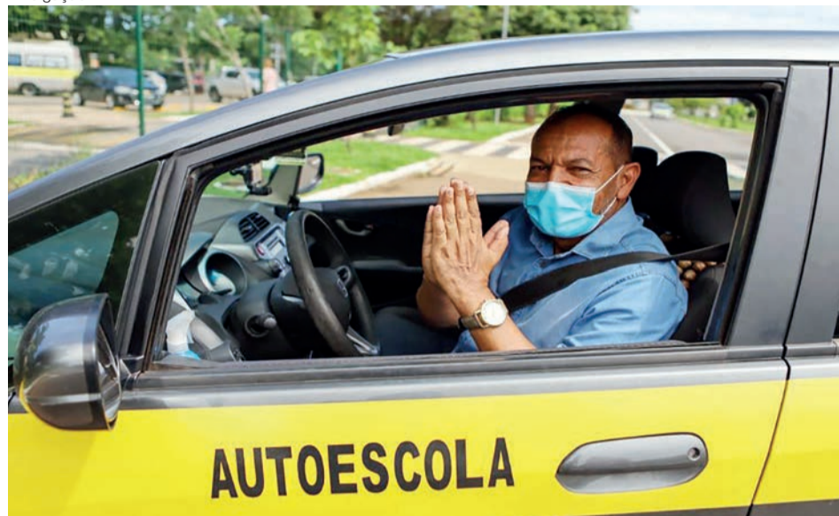
A segunda chamada com as vagas remanescentes deve ser divulgada no dia 29 de abril

Os selecionados têm de entregar a documentação em um posto de atendimento presencial até a próxima segunda-feira, dia 25