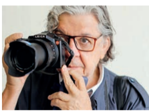
A Praça Central se tornará Galeria Orlando Brito

DA REDAÇÃO - Multicultural em sua natureza, o Espaço Cultural Renato Russo, que mantém em seu nome a homenagem a um dos maiores poetas do rock nacional, vai saudar a memória de três grandes artífices da arte brasileira que morreram nos últimos dois anos: o poeta e ativista cultural TT Catalão (1949-2020), o fotógrafo Orlando Brito (1950-2022) e o teatrólogo Hugo Rodas (1939-2022).