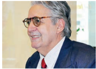
TT Catalão vai batizar a Gibiteca