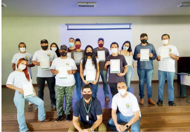
O programa Filhos deste Solo, idealizado pela Emater-DF em 2019, já capacitou 217 jovens

lize o curso com o plano de negócio efetivo, e não apenas com a teoria sobre o plano de negócios. Os participantes vão receber um roteiro para preencher ao longo das palestras e terão de duas a três perguntas para serem respondidas a cada treinamento. Somente ao final é que o aluno vai montar o planejamento do seu empreendimento.