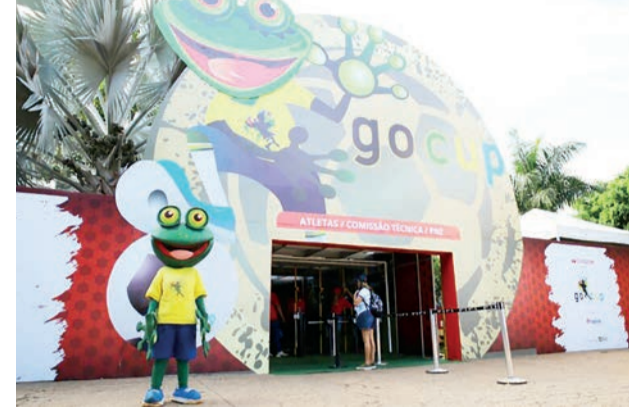
Equipes brasileiras e da América Latina disputam títulos de nove categorias até 16 de abril em um complexo esportivo privado no Jardim Bela Morada

Além de disputas acirradas dentro de campo, os atletas também se divertem em espaços recreativos com games, músicas, praça de alimentação e convivência. Para acompanhar os filhos, muitos pais mudam a rotina para incentivar os pequenos ‘craques’.