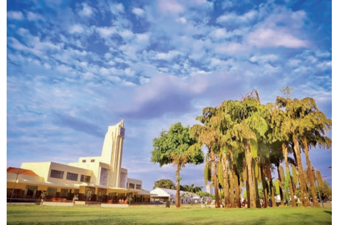
Museu Frei Confaloni, na Antiga Estação Ferroviária, abre, nesta quarta-feira (13/04), exposição Via Sacra, com 14 obras que remontam a trajetória de Jesus Cristo em sua Vida, Paixão, Morte e Ressurreição: obras ficam expostas de 14/04 a 14/05, no museu, de forma gratuita

Fiesole e, após passar pelo Convento de São Marcos, em Florença, chegou ao Brasil, em 1986. Peças compõem o único conjunto de obras com óleo sobre tela pintado por Frei Confaloni.