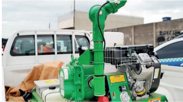
Caminhonete pronta para dispersar produto contra Aedes aegypti , na ação em Valparaíso de Goiás

de uma nova doença que pode causar sobrecarga na rede de saúde.