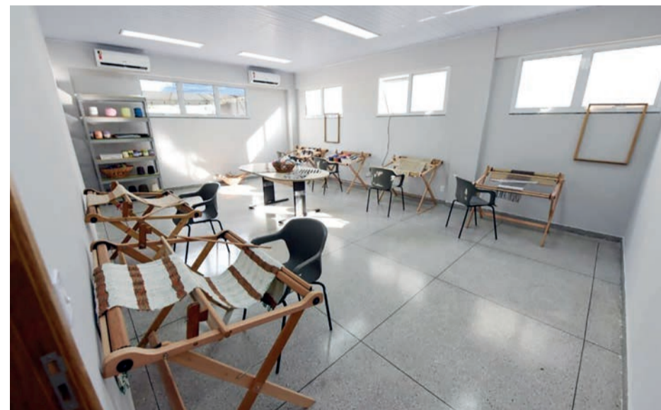
Centro de Geração de Emprego e Renda está equipado com laboratório para diversos cursos