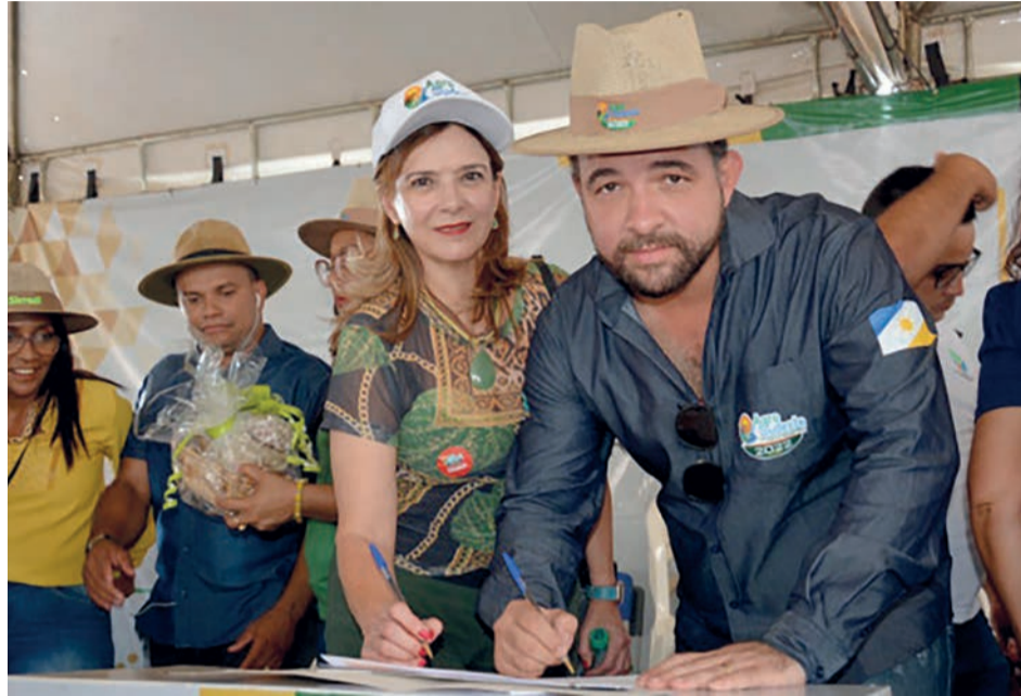
Gestores da Fomento e do Ruraltins assinam proposta de crédito para a piscicultura e a agricultura familiar

Recursos vão atender produtores da agricultura familiar; a região sudeste, que está entre as principais produtoras de pescado do Estado