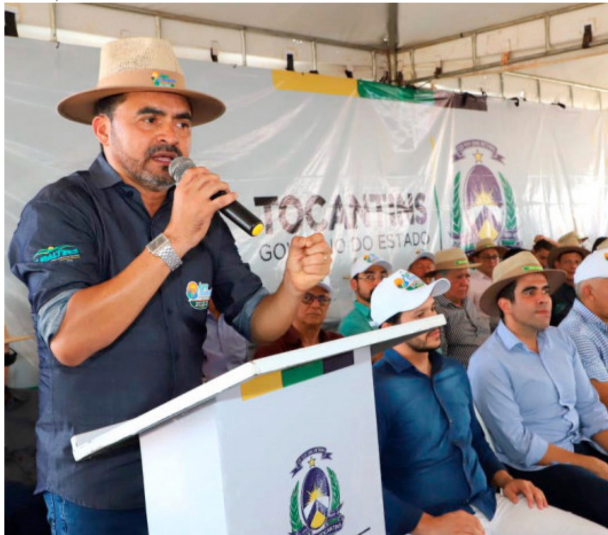
Governador Wanderlei Barbosa anuncia recurso de R$ 14 milhões para fomentar cadeia da piscicultura e da agricultura familiar