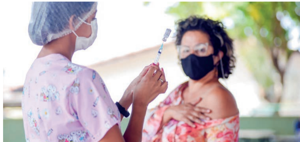
Prefeitura de Goiânia, por meio da Secretaria Municipal de Saúde, disponibiliza, no fim de semana (09 e 10 de abril), três postos de vacinação contra Covid-19 e Influenza: Van vai à Caravana do Bem-4º Mutirão do Governo de Goiás

A Secretaria Municipal de Saúde disponibiliza, no fim de semana (09 e 10 de abril), três postos de vacinação contra Covid-19 e Influenza. Além de dois postos fixos, a Prefeitura de Goiânia coloca nas ruas a van que faz busca ativa de pessoas que não estão com esquema de imunização completo. No sábado, o veículo estará na Caravana do Bem, local onde acontece a 4ª edição do Mutirão do Governo de Goiás, na Região Leste.