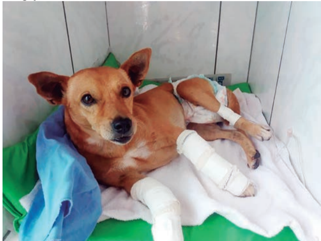
Cachorro resgatado pelo Brasília Ambiental recebe cuidados no Hospital Veterinário Público