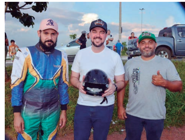
Um dos maiores eventos automobilísticos do País promete grandes atrações como show de drift, Festa do Mecânico, exposição de veículos antigos e superesportivos