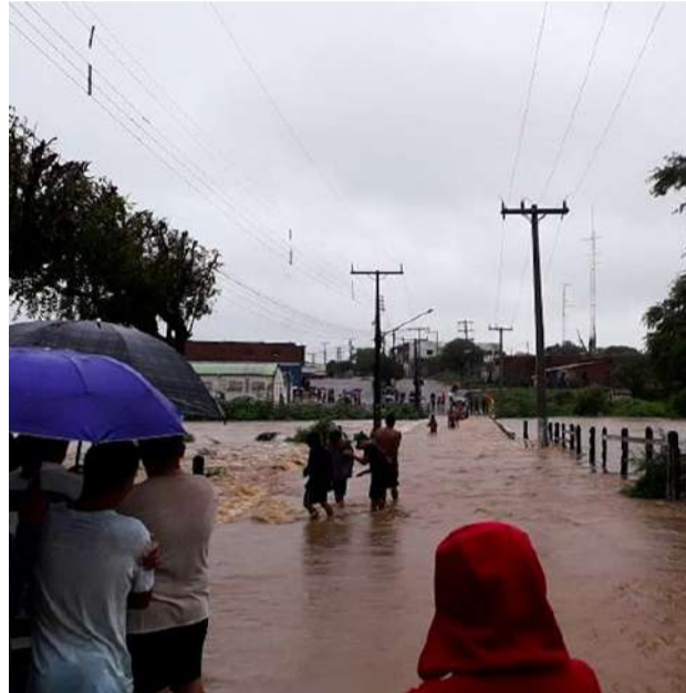
Corpo de Bombeiros de Paulo Afonso

A compensação para as vítimas dessas tragédias que perderam condições mínimas de trabalho e sustento deverá corresponder a três parcelas de seguro-desemprego, no valor de um salário mínimo, a serem pagas até seis meses após o ocorrido. O beneficiário da medida não poderá, entretanto, acumular essa ajuda financeira com o seguro-desemprego pago ao pescador artesanal ou qualquer outro auxílio de natureza previdenciária ou assistencial. O PL 1.057/2019 recebeu voto favorável, com emenda do relator, senador Paulo Rocha (PT-PA).