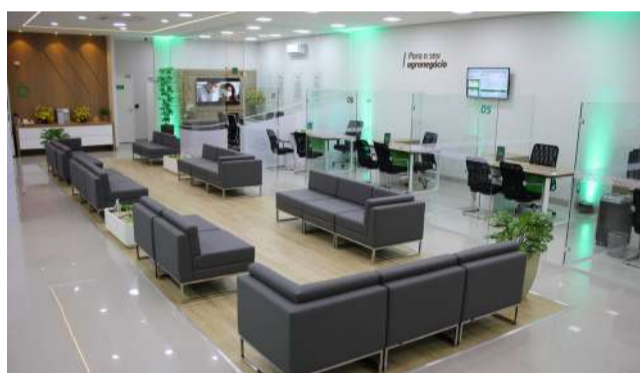
Agência localizada em Goiatuba - Goiás