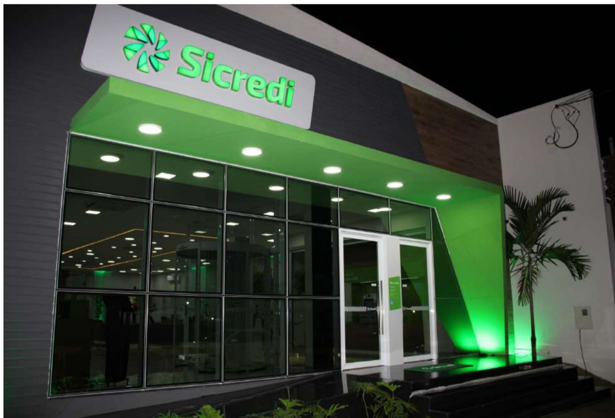
Agência Goiátuba - está localizada na Av. Presidente Vargas, n 440, Centro