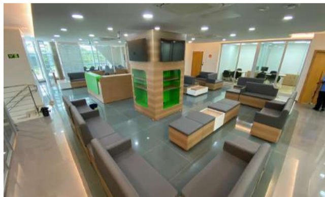
Agência Anápolis - Brasil Sul

Ainda mais, conta que está satisfeito com o desenvolvimento da companhia, os últimos anos tem sido fechados com dados positivos e crescendo a cada ano mais de 20%. “Estamos dobrando de tamanho a