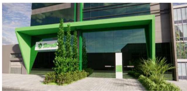
Agência em São Luís de Montes Belos

cada cinco anos”, explica. Além disso, esclareceu que as associações podem ser sócias do Sicredi.