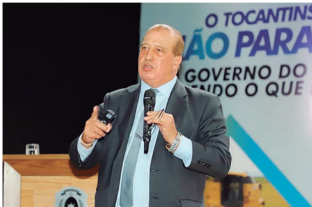
Ministro Augusto Nardes ressaltou que a governança promove a entrega de melhores resultados à população

Protocolo de Intenções com Instituto vai promover a capacitação de agentes públicos