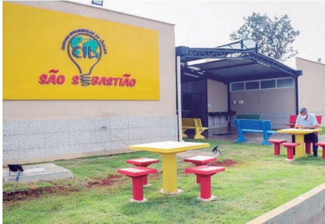
Nova unidade do CIL foi construída em local onde a estrutura de um albergue público estava abandonada há oito anos

em geral, pavimentação de estacionamento e a construção de quebra-molas na área externa.