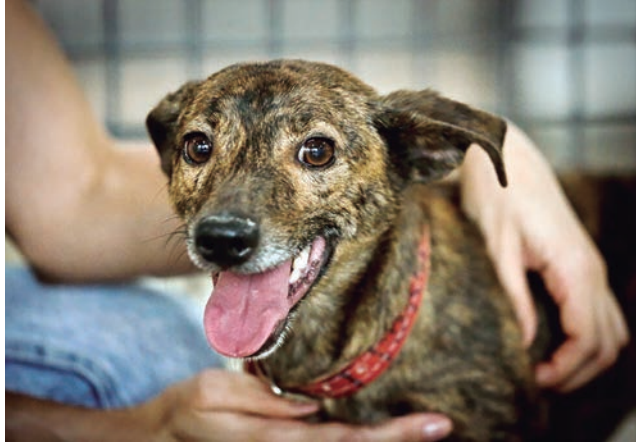
Todo cidadão pode opinar sobre a melhor forma de encaminhar cães e gatos que não estejam sendo bem-tratados