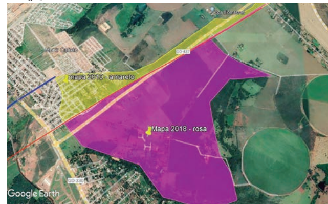
Mapas sobrepostos da região disputada entre Gameleira, Anápolis e Silvânia

Secretaria-Geral da Governadoria, do governo estadual, é responsável por pesquisas e estatísticas nas áreas de economia, geoprocessamento, geografia e ciências sociais. Seus mapas são referências para o IBGE realizar suas pesquisas, delimitar territórios e até divulgar o número de habitantes, o que determina a quantidade de verba federal que uma cidade pode receber.