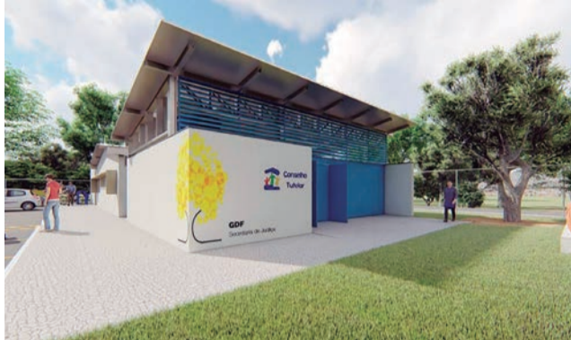
Projeção de um dos edifícios-sede dos conselhos tutelares

para que tenham as condições de trabalho adequadas e, assim, prestem o melhor atendimento possível às crianças, adolescentes e suas famílias”.