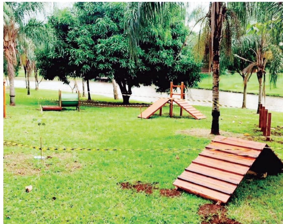
Estrutura é composta por vários aparelhos pensados especialmente para lazer de cães e gatos com famílias

Os goianienses têm um novo espaço para levar seus animais de estimação. O novo pet place da capital foi instalado no Parque Cascavel, um dos mais belos de Goiânia, e conta com arcos de pneus sustentados por balizas; barras verticais de obstáculos; túnel de manilha de concreto e rampa de madeira com degraus para fortalecimento muscular.