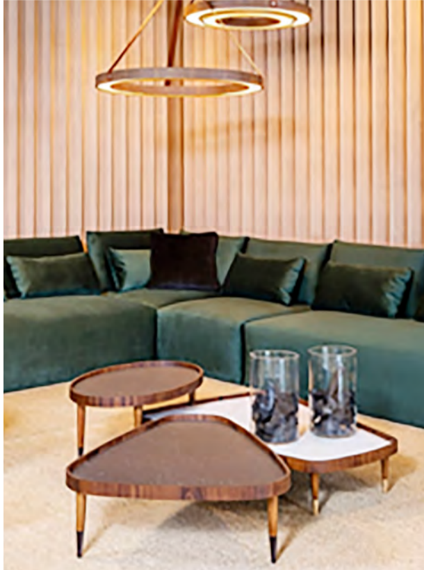
Mesa Safira - Tampo em MDF lâmina de alta pressão branca. Bordas em multilaminado Uraca. Pés de madeira maciça Uraca e Cor única - com ponteiras em alumínio. (L108 x P89 x A28 cm)