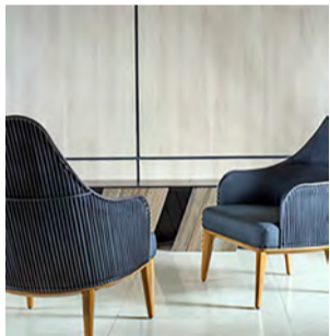
Poltrona Ayla - Base em madeira maciça Grandis. Encosto em inox nas cores opcionais. Espuma D26. (L 73 x P86 x A96 cm)