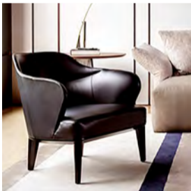
Poltrona Agata - Base em madeira maciça Grandis. Encosto em chapa multilaminada. Espuma D26 (L73 x P80 x A76 cm)