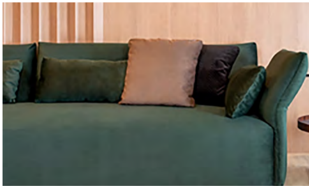
Sofá Soul - Estrutura em madeira maciça e chapa multilaminada. Espuma D26. Estrutura do encosto em aço com sistema retrátil. Não acompanha almofada decorativa. (L188 x P95 x A86 cm)