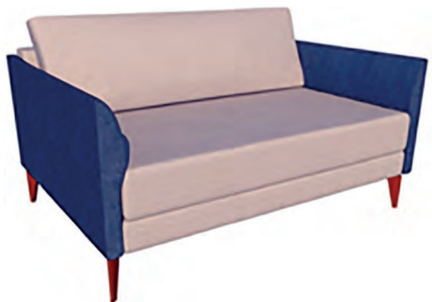
Sofá Horus - Estrutura em madeira maciça e chapa multilaminada. Espuma 26. Opção de pés em madeira maciça Grandis ou em alumínio. (L137 x P98 x A87 cm)