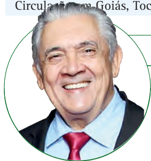
■ HD Hércules Dias www.herculesdias.com.br